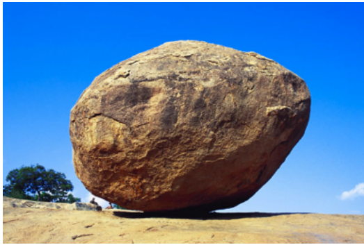
ЯВНЕ та ОЧЕВИДНЕ